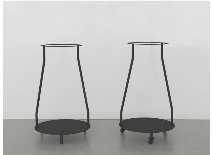
Svartlackerat inre stativ i RAL 9005.

Valfri RAL-kulör mot tillägg. Kontakta TreCe.