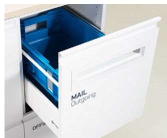
Låda anpassad för postens plastfack.