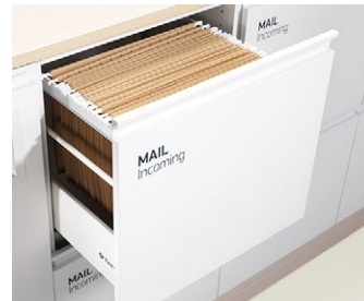
Lådor för mappar i folioformat, 365x240 mm, c/c 390 mm. Hängmappar finns som tillbehör.