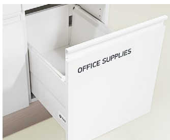
Utrymme lämpligt för kuvert etc.