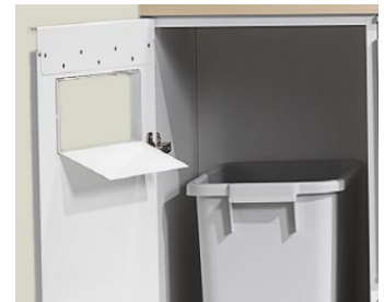
Dörr med inkast, 60-L returkärn ingår.