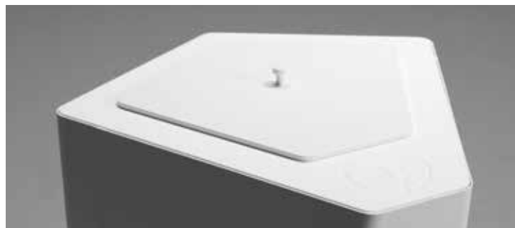
Kite lockinsats i lackerad MDF, NCS S 0500-N, vit.