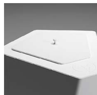
Kite lockinsats i lackerad MDF, NCS S 0500-N, vit.