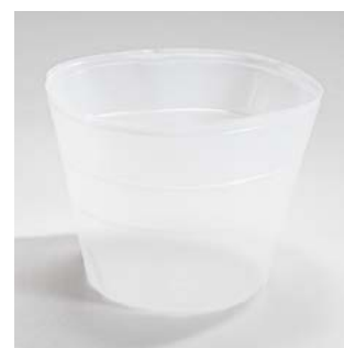
Kite fuktskyddsboten för enkel rengöring. Rekommenderas för våta fraktioner som restavfall, kompost och PET-flaskor/burkar.

Kites design gör den möjlig att placera ut på fria ytor eller mot en vägg.