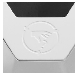
Nedfrästa symboler för olika sorters avfall.