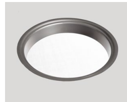
Håltagningen är nedfälld i bänkskivan.