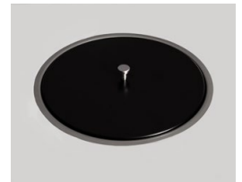
Locket i kompaktlaminat, (F2297).