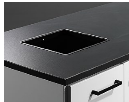
Håltagning med lackad insats i stål, 250x250 mm.