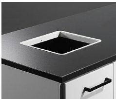
Håltagning med lackad insats i stål, 250x250 mm.