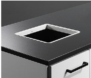
Håltagning med lackad insats i stål, 250x250 mm.