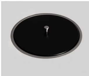
Locket i kompaktlaminat, (F2297).