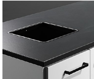
Håltagning med lackad insats i stål, 250x250 mm.