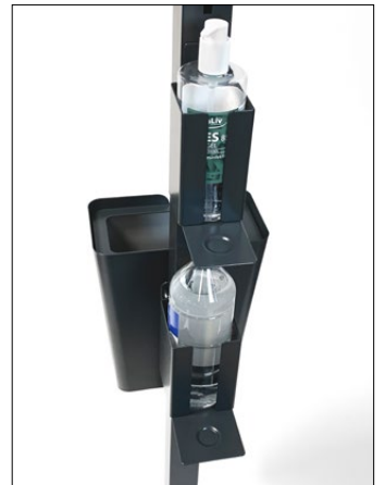
Clean dispenserhållare, Small och Large.