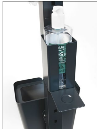
Clean dispenserhållare, Small.