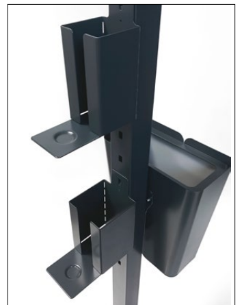
Clean dispenserhållare, Small, Large och Hold mini.