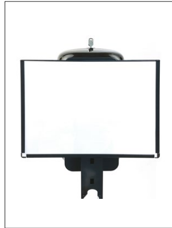
Clean skylthållare A4.