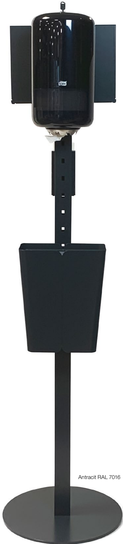
Antracit RAL 7016