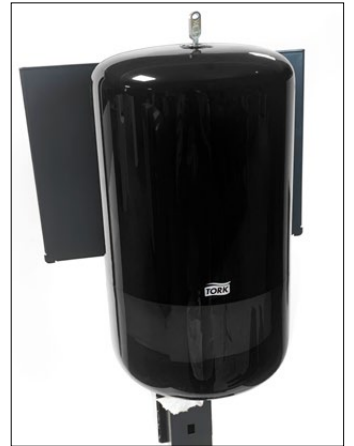
Clean färste Tork M1. Tork M1 ingår ej*.