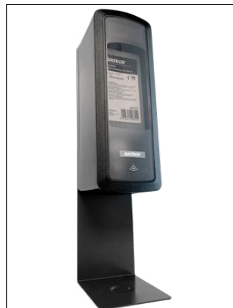
Clean fäste Katrin touchfree alkogel-dispenser. Katrin dispenser ingår ej*.