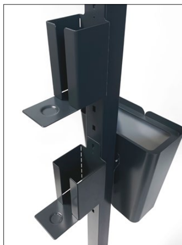
Clean dispenserhållare, Small, Large och Hold mini.