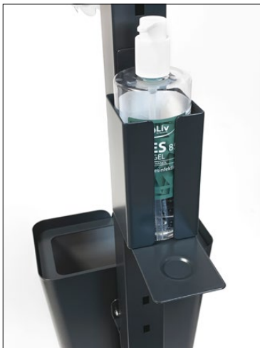
Clean dispenserhållare, Small.