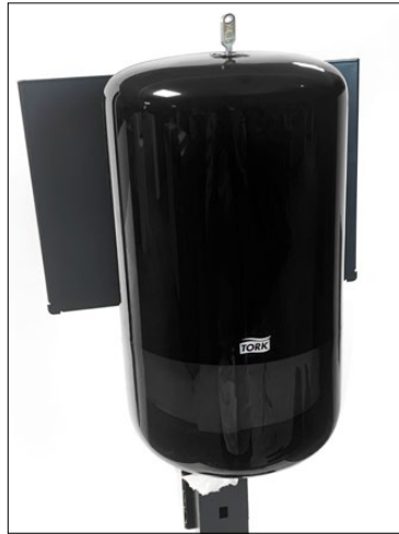
Clean färste Tork M1. Tork M1 ingår ej*.