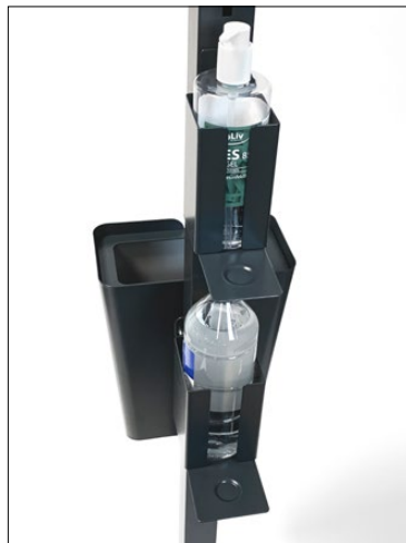
Clean dispenserhållare, Small och Large.