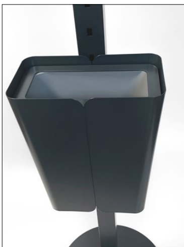
Clean Hold mini.