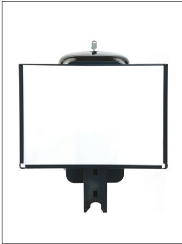
Clean skylthållare A4.