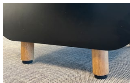
Lackade ben i ek