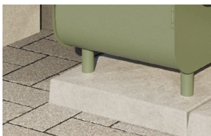
Rostfria lackade ben med betongfot