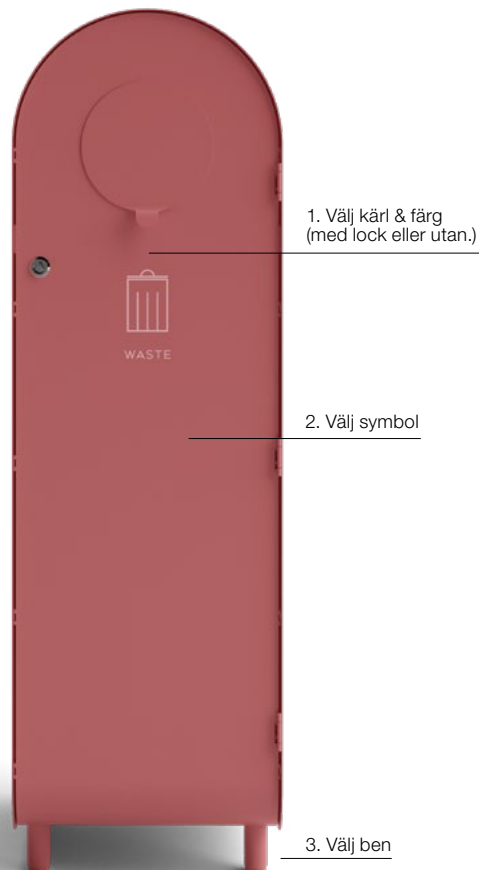
Hightower med lock