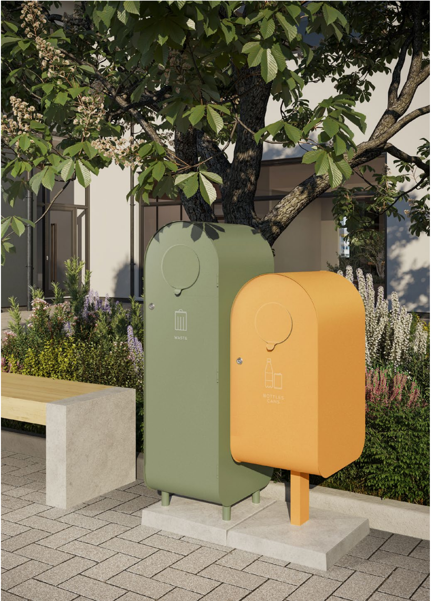
Hightower i Oliv RAL 6013 tillsammans med Popsicle i Saffran RAL 1017