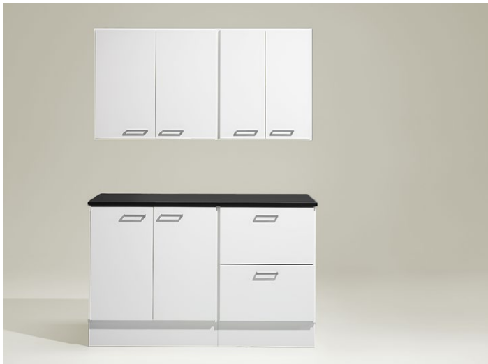
Kopieringsstation 3. Kombination bestående av diskar och väggskåp. Längd 1420 mm.