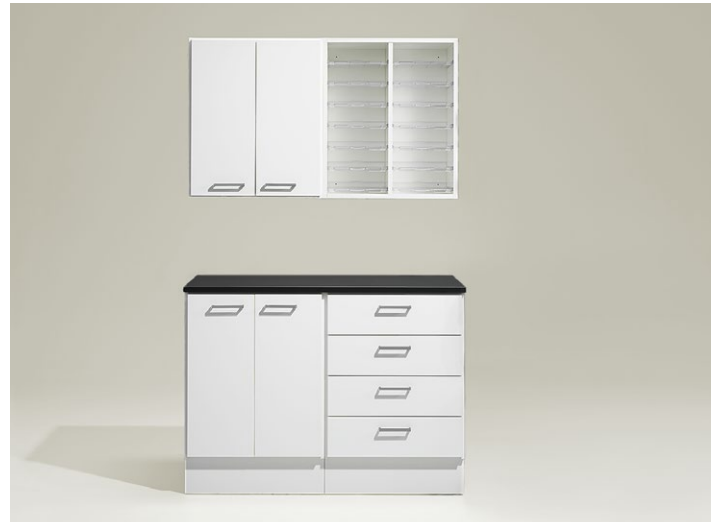
Kopieringsstation 4. Färdig kombination bestående av diskar, väggskåp och posthyllor. Längd 1220 mm.