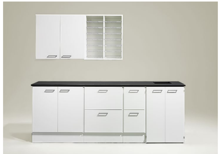
Kopieringsstation 2. Kombination bestående av diskar, väggskåp och posthyllor samt miljöstation. Längd 2380 mm. Returkärl ingår ej, finns som tillbehör.