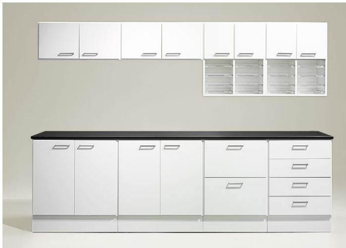
Kopieringsstation 1. Kombination bestående av diskar, väggskåp och posthyllor. Längd 2800 mm.